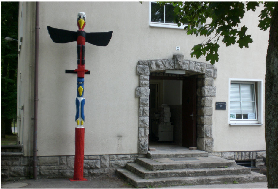
Der Marterpfahl aus Dautphe, steht nun in Oberdachstetten!

Das Camp in Oberdachstetten, in einer ausgedienten Kaserne: