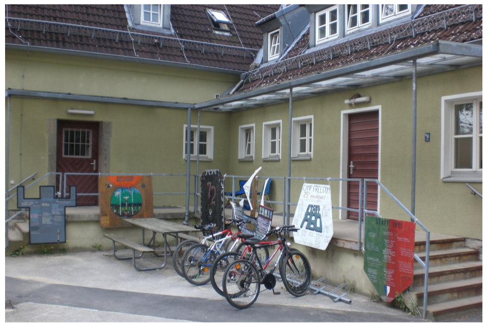
Eingang zum Büro und Speisesaal

Dann folgte die letzte und traurigste Phase des Camps.