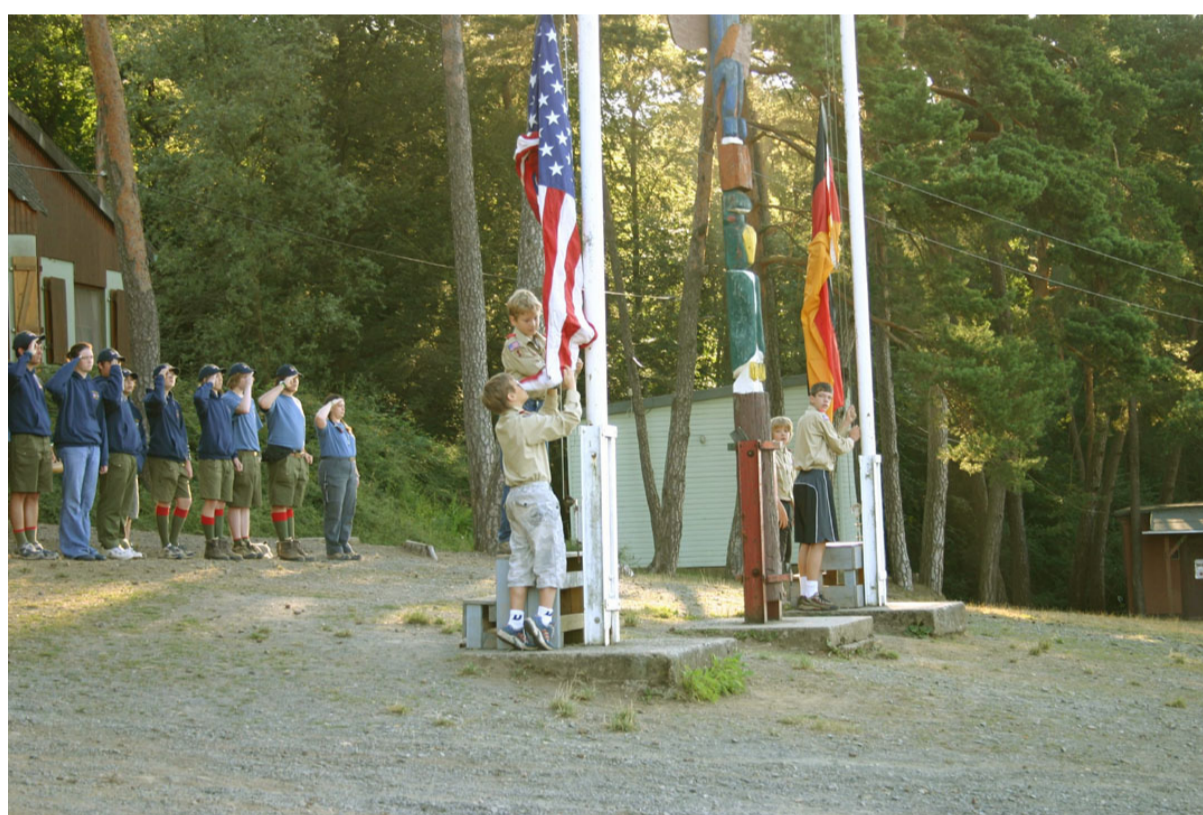
Boy Scout Troop 230 aus Stavanger/Norwegen, beim Einholen der Fahnen.