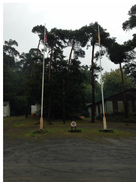
Da das Camp nun schon so lange leer stand, wurde ein Zeltlager unterhalb des Camps errichtet!