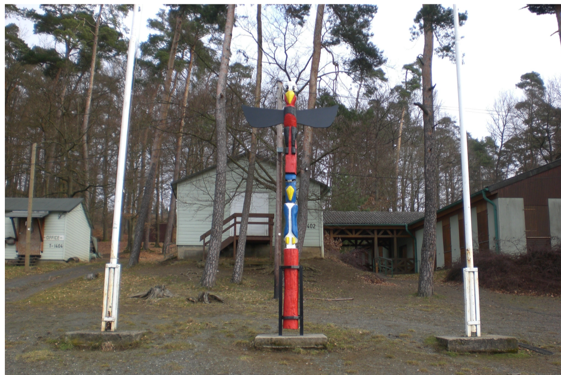
Der Marterpfahl des Camps zwischen den Fahnenmasten.

Nach 52 Jahren war es dann beschlossene Sache! Das Camp Freedom in Dautphe soll geschlossen werden. Da die US Army aus Gießen abzog, fiel die nahegelegene Unterstützung mit Lebensmitteln aus dem „PX“ und anderen Waren und Gegenständen weg. Das Camp soll an einen anderen Standort verlegt werden, von wo aus die US Army die Unterstützung weiter gewährleisten kann.