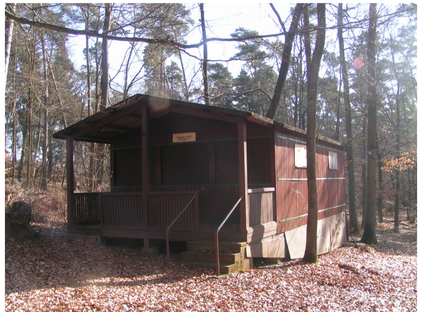
Die „Trading Post“ hier gab es „alles“ zu kaufen...